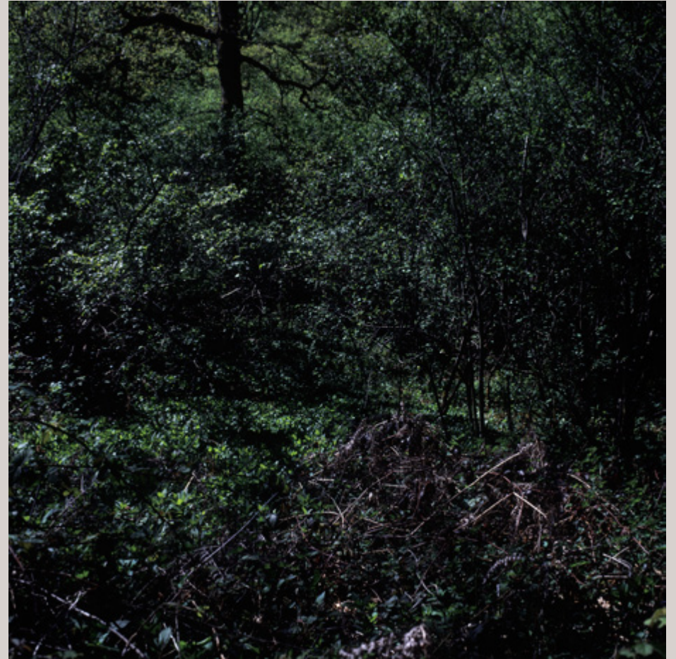
Le bois des Loges, à 2 km