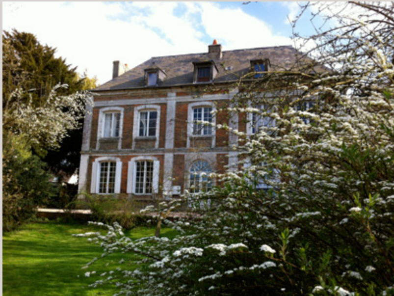
Le presbytère côté verger