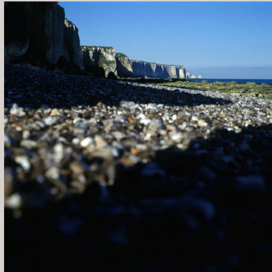
La Haye d'Étignes, à 10 km