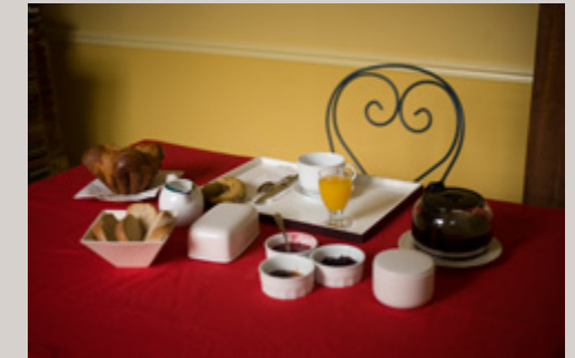
salle et petit-déjeuner: pains frais, viennoiseries et confitures maison.